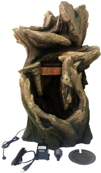
Carefully unpack and arrange all parts.

We hope you will find these instructions helpful in setting up your product. If you have any issues with this item, DO NOT return the unit to place of purchase. Please visit our web site www.angelodecor.com for assistance and warranty information.