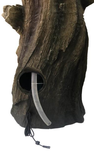
Retrieve the tubing and light cable from inside the fountain.