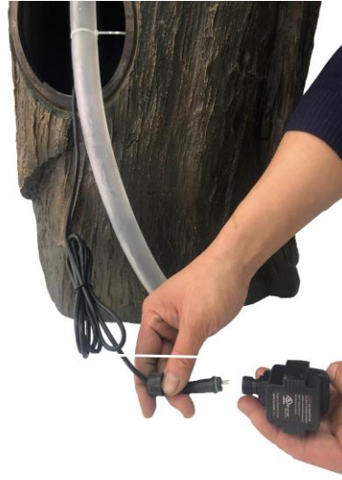
Securely attach the light cable to the power supply.