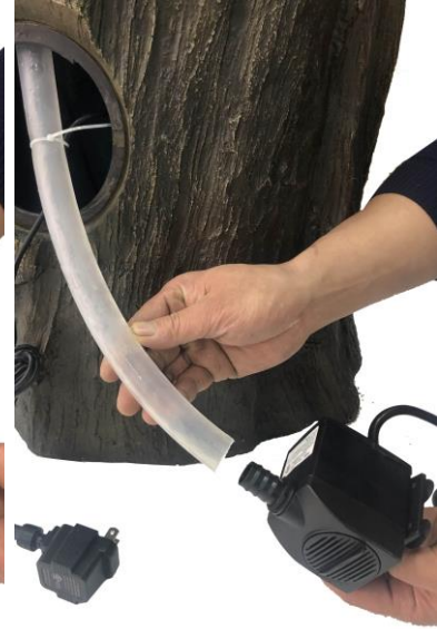
Attach the tubing to the pump. If needed, water flow can be adjusted using the flow control on the pump.