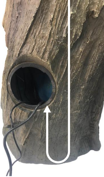
Place the pump inside the fountain. To prevent the risk of water loss, create a drip loop with the cable from the light.