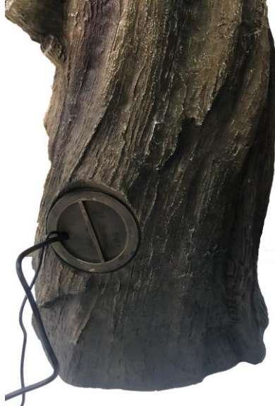
Align the cords and install the pump access door as shown.