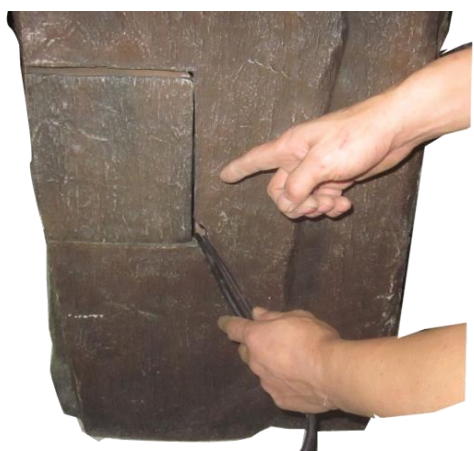
Placez la pompe à l'intérieur de la fontaine. Alignez les cordons et installer la porte d'accès de la pompe.