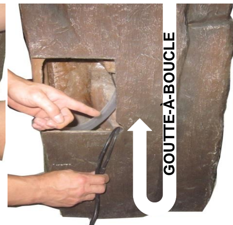
IMPORTANT: pour éviter la perte de l'eau, créer un goutte-à-boucle avec les cordes de lumière en les plongeant dans le réservoir avant qu'ils sortent à l'arrière de la fontaine.