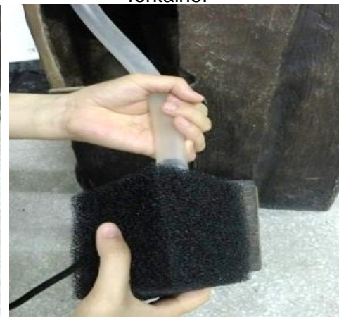
Trouver le tube de l'intérieur de la fontaine et l'attacher à la sortie de la pompe.