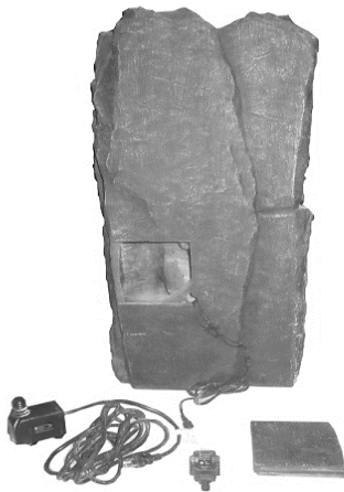
Carefully unpack and arrange all parts.

We hope you will find these instructions helpful in setting up your product. If you have any issues with this item, DO NOT return the unit to place of purchase. Please visit our web site www.angelodecor.com for assistance and warranty information.