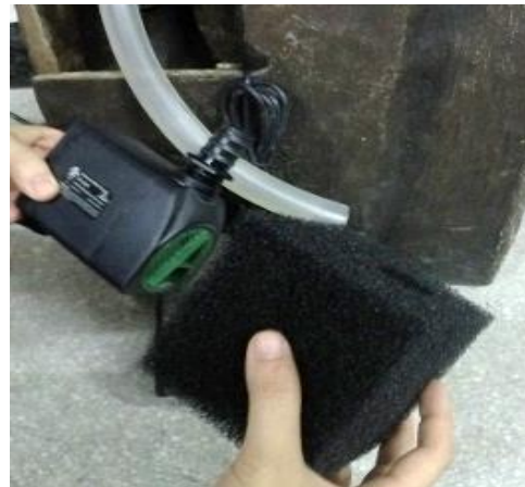
Insert the pump into the included PumpJacket™ pump filter.