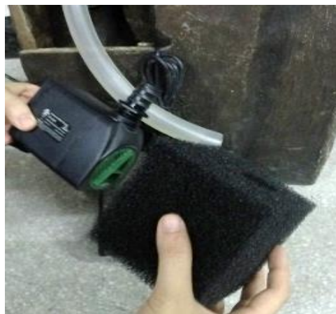
Insérez la pompe dans le filtre de la pompe Pumpjack™ inclus.