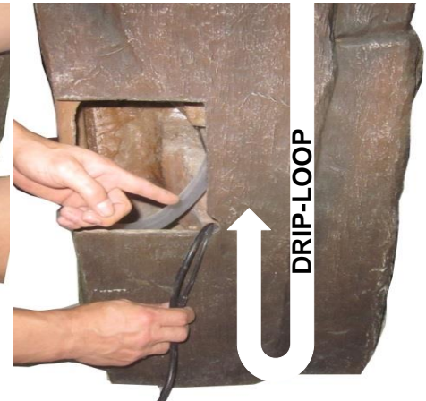
IMPORTANT: to prevent water loss, create a drip-loop with the light cords by dipping them into the reservoir before they exit out the back of the fountain.