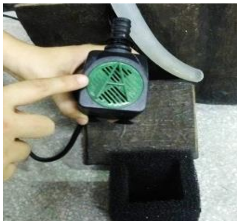
La pompe est pré-réglée pour le réglage optimal. Régler le débit de l'eau au besoin en utilisant la molette.