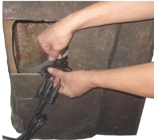
Retrieve the light connection from inside the fountain. The light connection must sit outside the fountain.