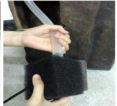
Locate the tubing from inside the fountain and attach it to the output of the pump.