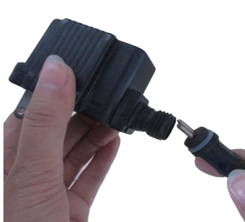
Fixez le cordon d'alimentation de l'éclairage au transformateur.