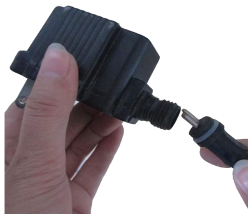
Attach the cord from the lights to the transformer.