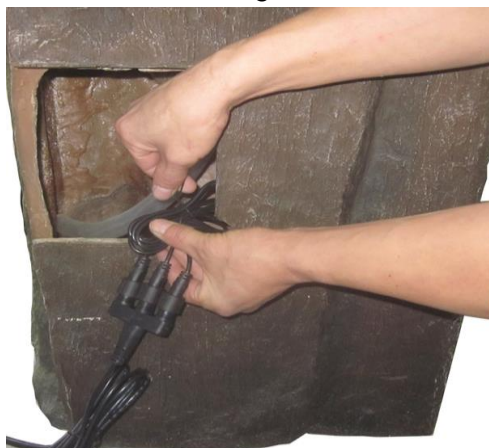
Récupérer la connexion la lumière à l'intérieur de la fontaine. La connexion de la lumière doit rester en dehors de la fontaine.