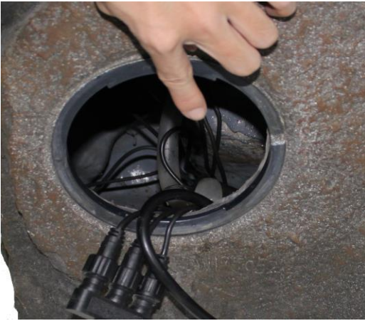
Place the pump inside the fountain.