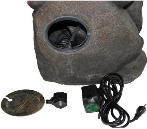
Carefully unpack and arrange all parts.

We hope you will find these instructions helpful in setting up your product. If you have any issues with this item, DO NOT return the unit to place of purchase. Please visit our web site www.angelodecor.com for assistance and warranty information.