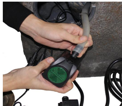
Trouvez le tube à l'intérieur de la fontaine et fixez-le à la pompe. Le débit d'eau peut être ajusté avec le cadran.