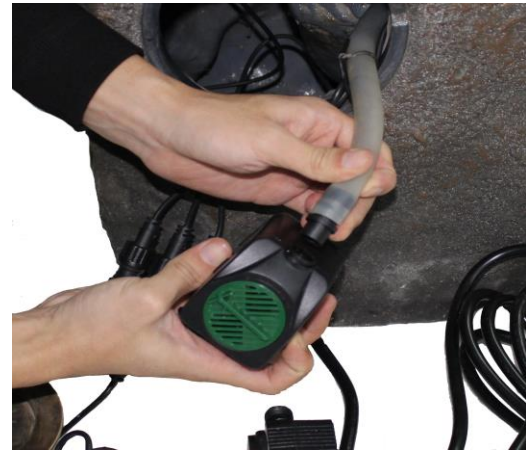
Locate the tubing from inside the fountain and attach it to the pump. Water flow can be adjusted with the dial.