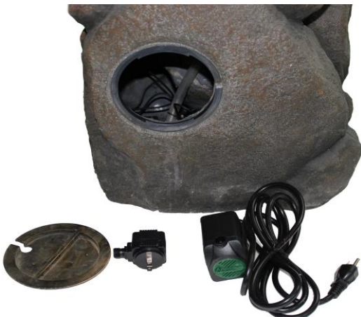
Déballez et arrangez soigneusement toutes les pièces.

Nous espérons que vous trouverez ces instructions utiles en assemblant votre produit. Si vous avez n'importe quelles issues avec cet article, ne renvoyez pas l'unité à l'endroit de l'achat. Veuillez visiter notre site Web www.angelodecor.com pour l'information d'aide et de garantie.