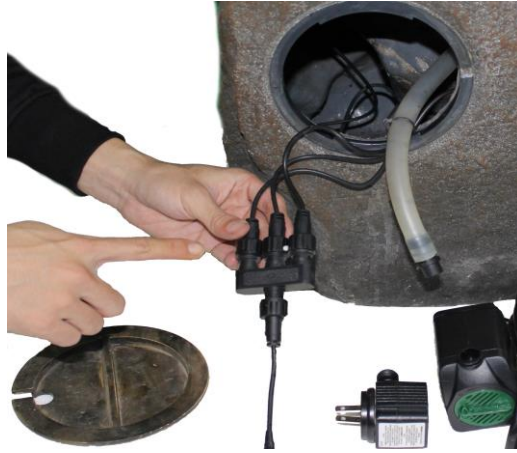
Retrieve the light connection from inside the fountain. The light connection must sit outside the fountain.