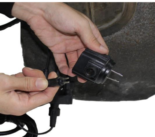
Attach the cord from the lights to the transformer.