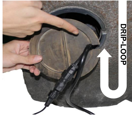
IMPORTANT: to prevent water loss, create a drip-loop with the light cords by dipping them into the reservoir before they exit out the back of the fountain. Align the cords and install the pump access door.