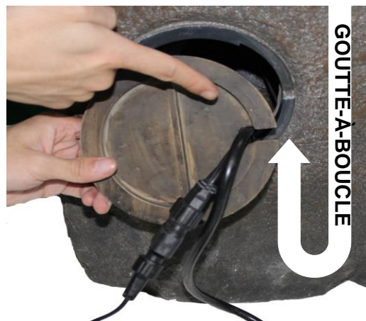
IMPORTANT: pour éviter la perte de l'eau, créer un goutte-à-boucle avec des câbles de lumière en les plongeant dans le réservoir avant qu'ils sortent à l'arrière de la fontaine. Alignez les cordons et faites glisser la porte d'accès de la pompe en place.