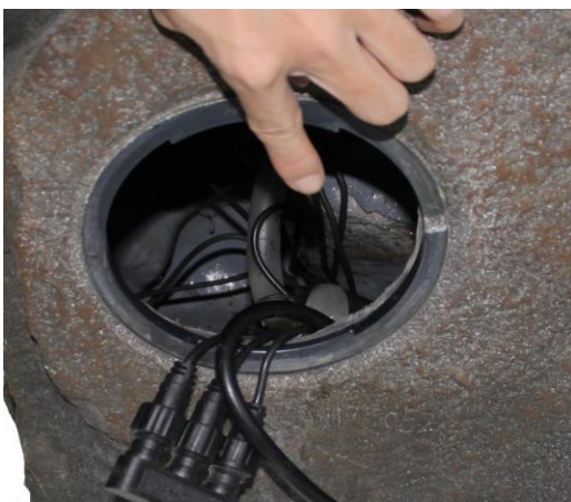
Placez la pompe à l'intérieur de la fontaine.