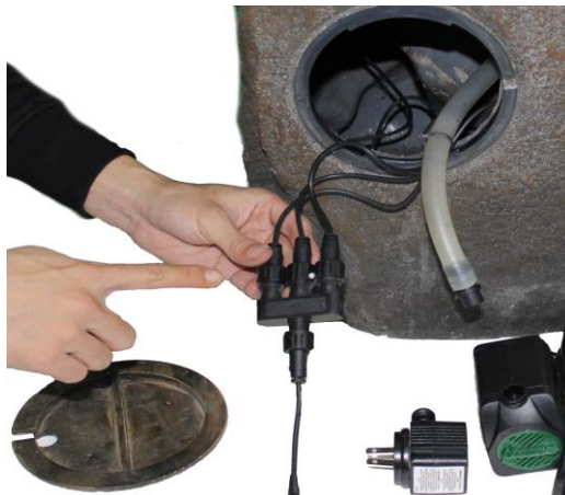
Récupérez la connexion lumineuse de l'intérieur de la fontaine. La connexion lumineuse doit être placée à l'extérieur de la fontaine.