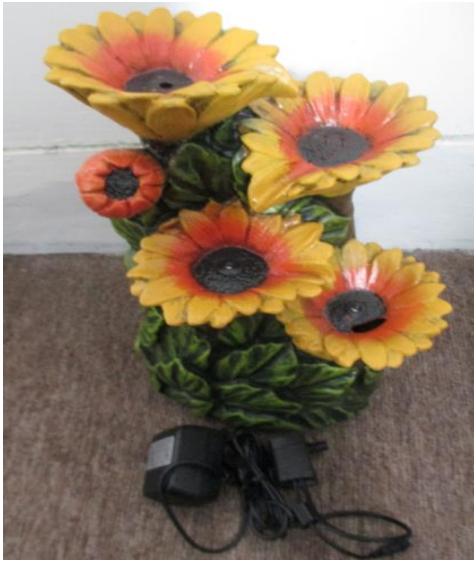
Déballer et arranger toutes les pièces.

Nous espérons que vous trouverez ces instructions utiles en assemblant votre produit. Si vous avez n'importe quelles issues avec cet article, ne renvoyez pas l'unité à l'endroit de l'achat . Veuillez visiter notre site Web www.angelodecor.com pour l'information d'aide et de garantie.