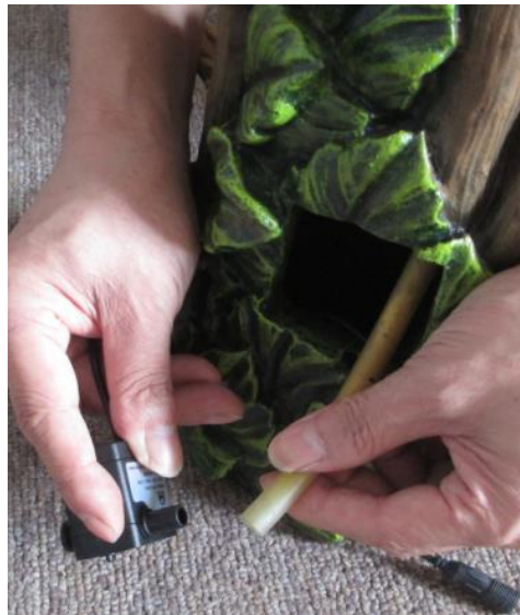
Locate the tubing from inside the fountain and attach it to the pump.