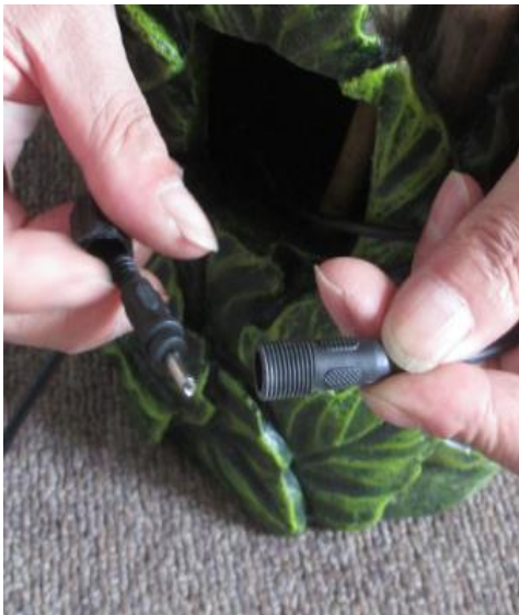
Locate and attach the cord from the lights (pre-installed) to the shortest cord from the pump. This connection should remain outside the fountain.