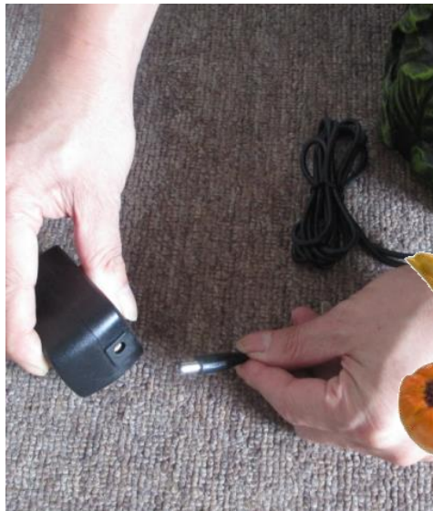
Attach the long cord from the pump to the transformer as shown above.