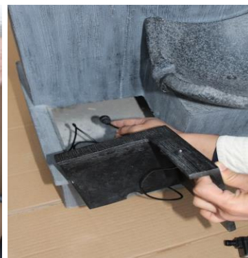
Pass the cord from the light out the access hole at the back.