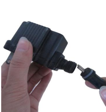
Attach the cord from the connector to the transformer.