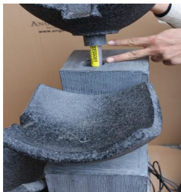
Pass the tubing in to the body of the fountain and set the top in place as shown.