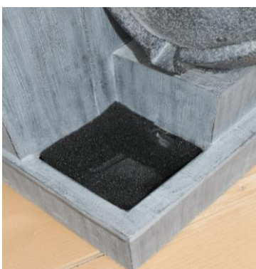
If desired, position the black foam inside the opening of the lowest bowl as shown to help curb unwanted splashing and hide the pump from view.