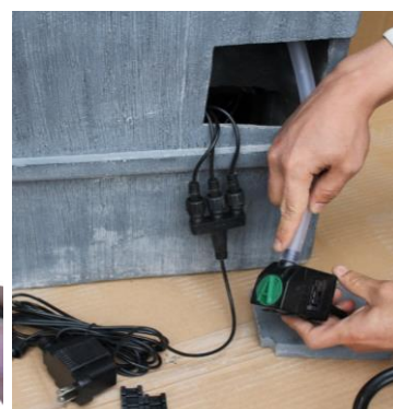
Branchez le tuyau à la pompe puis placez la pompe à l'intérieur de la fontaine.