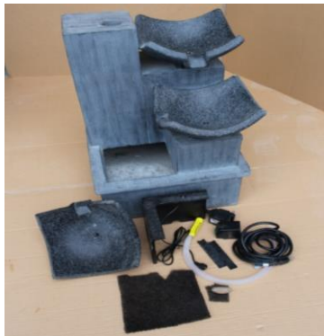
Déballer et arranger toutes les pièces.

Nous espérons que vous trouverez ces instructions utiles en assemblant votre produit. Si vous avez n'importe quelles issues avec cet article, ne renvoyez pas l'unité à l'endroit de l'achat . Veuillez visiter notre site Web www.angelodecor.com pour l'information d'aide et de garantie.