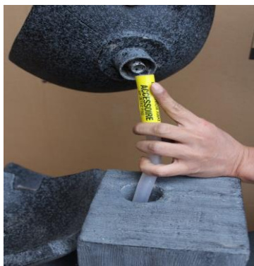
Connect the tubing to the top.