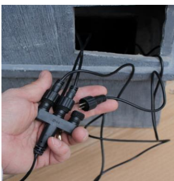
Branchez le cordon de lumière au connecteur. La connexion de la lumière doit rester en dehors de la fontaine.