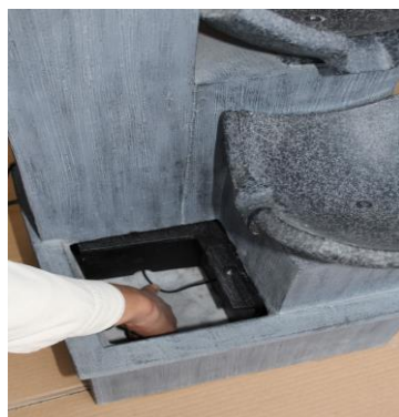
Place the L-shaped plate in position as shown above and align the cord with the groove.