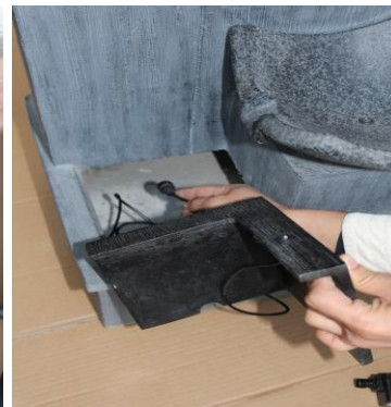
Passez le cordon de la lumière sur le trou d'accès à l'arrière.