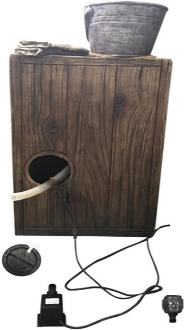
Carefully unpack and arrange all parts.

We hope you will find these instructions helpful in setting up your product. If you have any issues with this item, DO NOT return the unit to place of purchase. Please visit our web site www.angelodecor.com for assistance and warranty information.