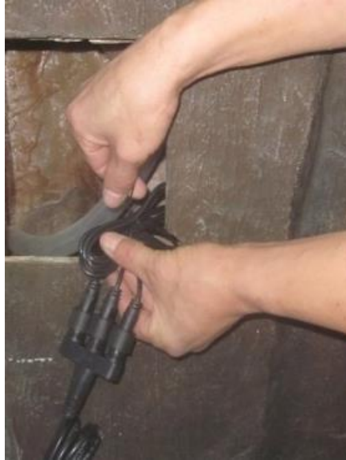
Retrieve the light connection from inside the fountain. The light connection must sit outside the fountain.