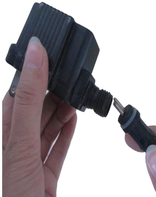
Attach the cord from the lights to the transformer.

Align the cords and install the pump access door in place.