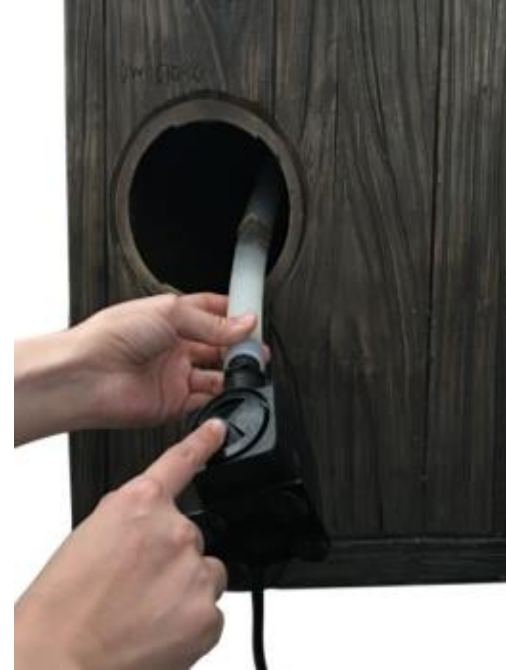
Locate the tubing from inside the fountain and connect it to the pump. Place the pump inside the fountain.