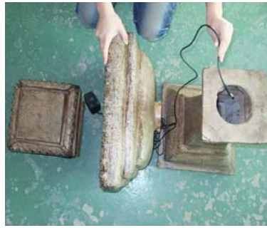
Carefully rest the bowl on its side. Feed the power cord down the pedestal and out the base. Align the power cord with the groove at the base of the pedestal.