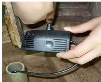
Connect the tubing from the top to the pump.