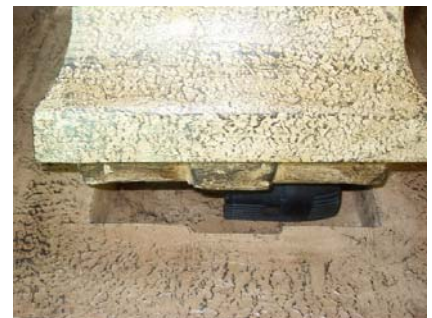
Gently lower the top in place.